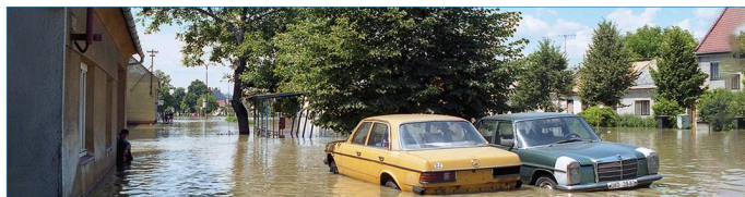
1. Výstražné informace

Mobilní aplikaci Hlášenírozhlasu.cz najdete na Google Play.