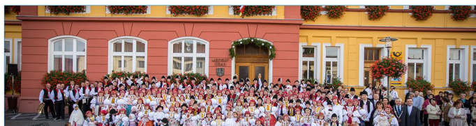
3. Kulturní a sportovní akce