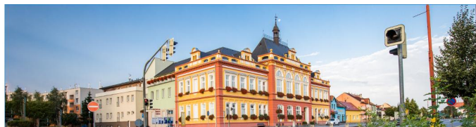
2. Informace městského úřadu